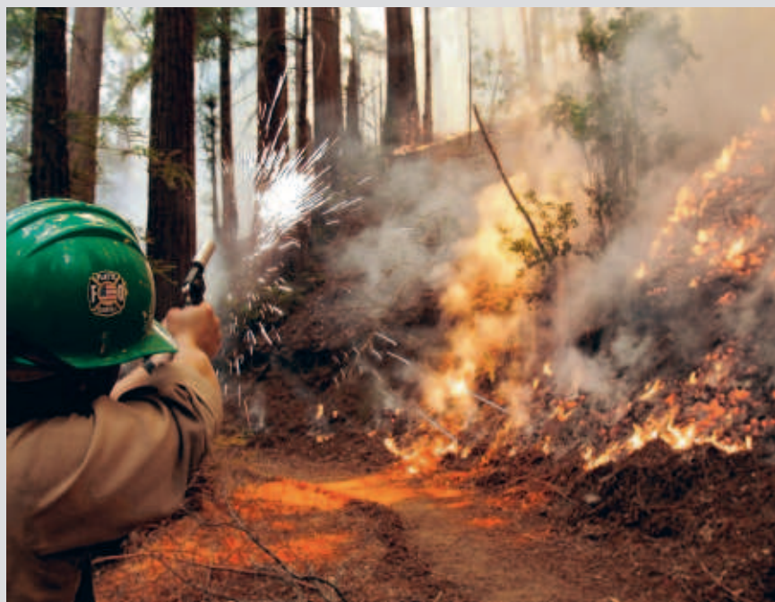
■ Een brandweerman gebruikt een speciaal pistool bij een woudbrand in Big Sur.