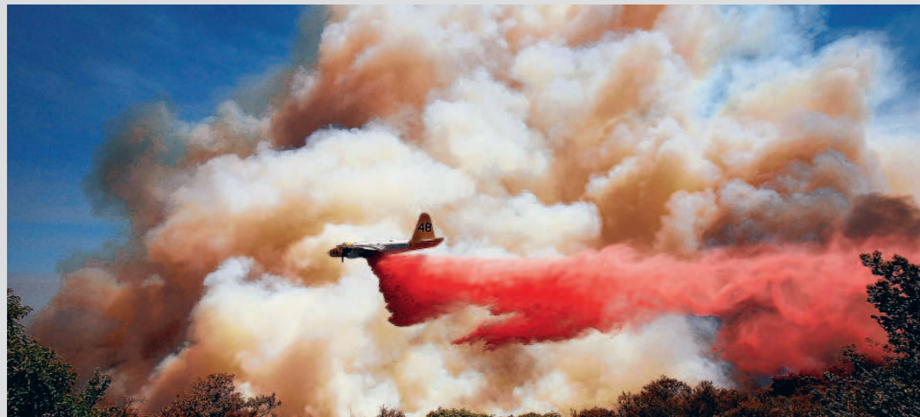
■ Een gespecialiseerd watervliegtuig dropt brandafremmende stoffen over de vlammen.

LOS ANGELES • Liefst achtentachtig brandhaarden, tienduizenden geëvacueerde mensen en 3.400 vierkante kilometer verschroeide aarde. Het zijn cijfers die de Amerikaanse staat Californië het trieste record opleveren van de grootste bosbranden uit haar geschiedenis. De 20.000 brandweermannen hebben intussen hulp gekregen van een onbemand NASA-vliegtuig. Dat bezorgt brandweercommandanten in real time foto's van brandhaarden en plaatsen waar het vuur weer opflakert. Voor bemande vliegtuigen was het door de dikke rook en de hitte onmogelijk om over het gebied te vliegen. "Het NASA-toestel is een echte redder van mensenlevens", zegt gouverneur Arnold Schwarzenegger. De meeste haarden ontstonden als gevolg van een onweersstorm op 21 juni. (TS)