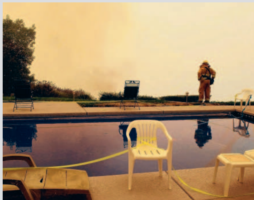
■ Een blusgast monitort een woning in Concow, die bedreigd wordt door een vuurzee.